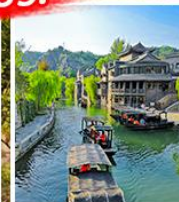
กุ่เป่ย์ส่วยเจิ้น

ชมหนึ่งในสิ่งมหัศจรรย์ของโลก #นั่งกระเช้าขึ้นกำแพงเมืองจีน (ด้านซือหม่าไถ)