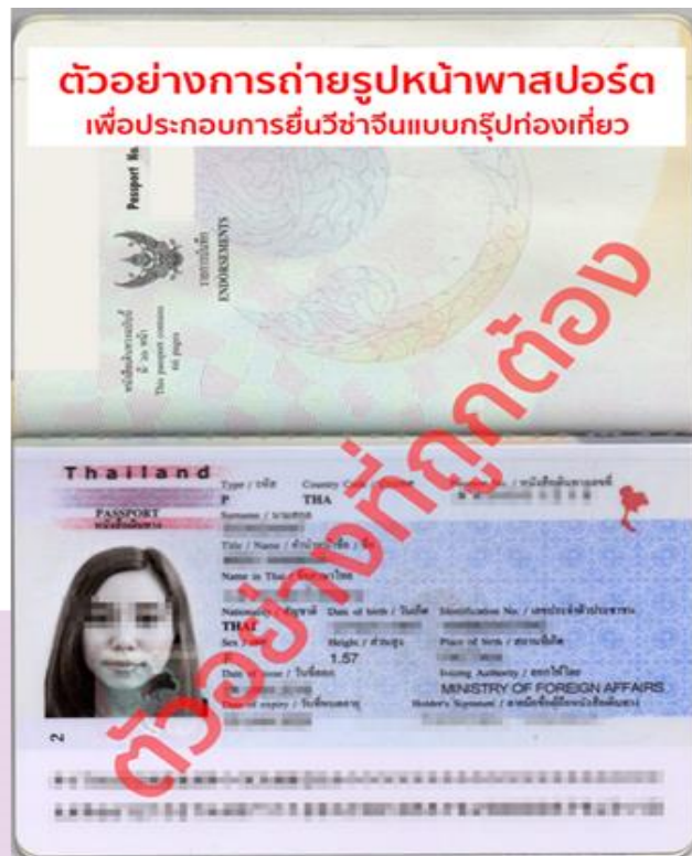
ตัวอย่างการถ่ายรูปหน้าพาสปอร์ต กรณียื่นวีซ่าแบบกรุ๊ปท่องเที่ยว ต้องถ่ายให้ติดทั้ง 2 หน้าแบบตัวอย่าง