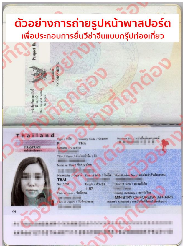
ตัวอย่างการถ่ายรูปหน้าพาสปอร์ต กรณียื่นวีซ่าแบบกรุ๊ปท่องเที่ยว ต้องถ่ายให้ติดทั้ง 2 หน้าแบบตัวอย่าง