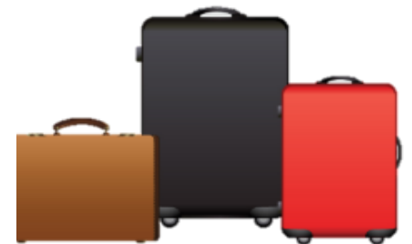
น้ำหนักกระเป๋า 20 กิโลกรัมต่อท่าน

** เนื่องจากเป็นตั๋วเครื่องบิน จึงไม่สามารถเคลมค่าอาหารได้ **