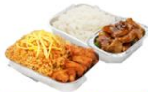
บริการอาหารร้อน ไป-กลับ บนเครื่อง

** เนื่องจากเป็นตั๋วเครื่องบิน จึงไม่สามารถเคลมค่าอาหารได้ **