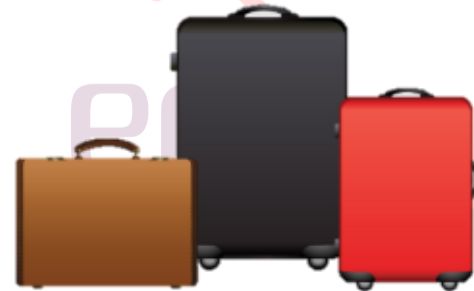
น้ำหนักกระเป๋า 20 กิโลกรัมต่อ

** เนื่องจากเป็นตั๋วเครื่องบิน จึงไม่สามารถเคลมความเสียหายได้ **