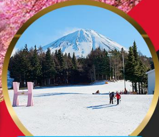
Fujiten Ski Resort