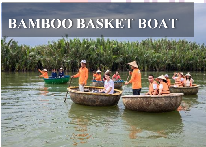
BAMBOO BASKET BOAT

นำท่านทำกิจกรรม ล่องเรือกระด้ง ท่านจะได้รับชมวัฒนธรรมอันสวยงามของชาวท้องถิ่น และระหว่างที่ล่องเรือกระด้งอยู่นั้นชาวบ้านที่นี้ก็จะมีกรับร้องเพลงพื้นเมือง และนำไม้พายเรือมาเคาะเพื่อประกอบเป็นจังหวะดนตรี