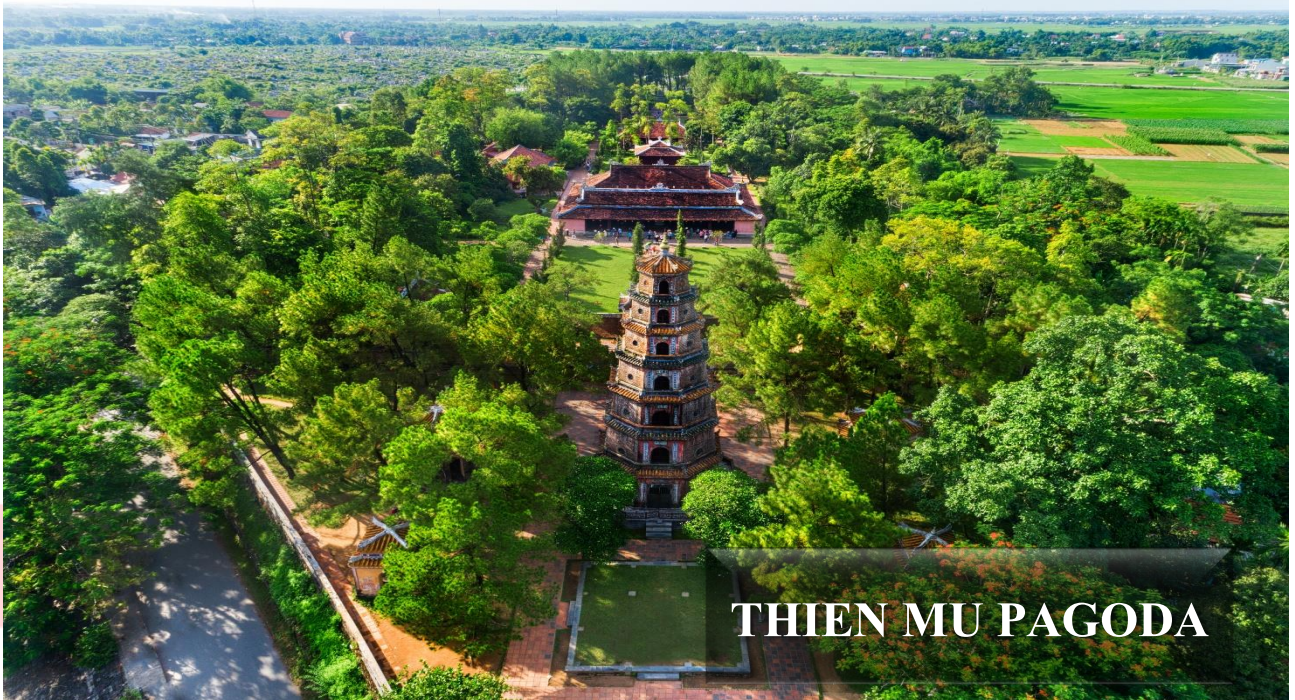
THIEN MU PAGODA

หลังอาหารค่ำนำท่าน ล่องเรือมังกรชมแม่น้ำหอม แหล่งกำเนิดของแม่น้ำหอมมาจากบริเวณต้นน้ำที่อุดมไปด้วยดอกไม้ป่าที่ส่งกลิ่นหอม เป็นแม่น้ำสายสั้นๆ บนเรือทางจะได้ชมการแสดงดนตรีพื้นบ้าน และนักร้องชาวเวียดนามที่จะมาขับกล่อมบทเพลงให้ท่านได้สนุกสนาน (ใช้เวลาล่องเรือโดยประมาณ 45-60 นาที) นำทุกท่านเดินทางต่อไปยัง ตลาดตองบา เป็นตลาดสินค้าขนาดใหญ่ที่อยู่ติดกับแม่น้ำหอม ให้ทุกท่านได้เลือกซื้อของฝาก