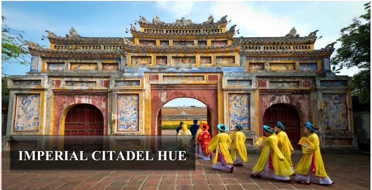
IMPERIAL CITADEL HUE