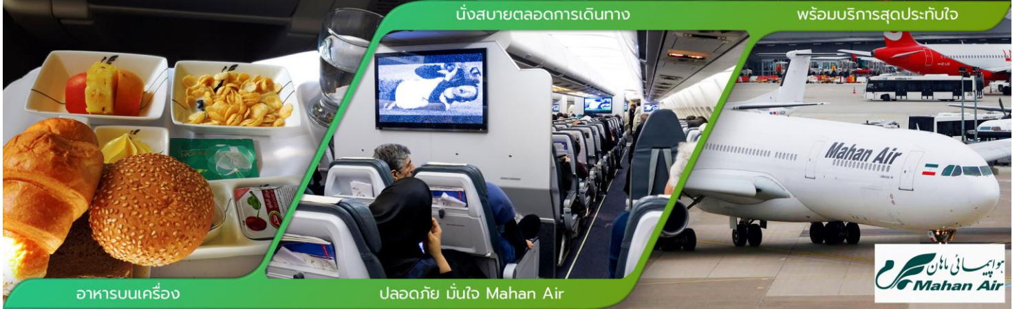
อาหารบนเครื่อง

20.30 น. ☝ คณะผู้เดินทางพร้อมกัน ณ สนามบินสุวรรณภูมิอาคารผู้โดยสารขาออกระหว่างประเทศ ชั้น4 สายการบิน Mahan Air เคาน์เตอร์ S ประตู 8 ซึ่งมีเจ้าหน้าที่ของบริษัทคอยอำนวยความสะดวกเรื่องสัมภาระและเอกสารการเดินทางแก่ท่าน