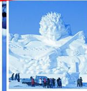
เกาะพระอาทิตย์