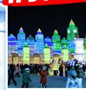
เทศกาลปิงเว่ยต้าซือเจีย

แจกฟรี!! หมวก ผ้าพันคอ ที่ปิดหู แผ่นรองกันหนาว กานละ 1 ชุด