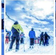
ลานสกียาบูลี่