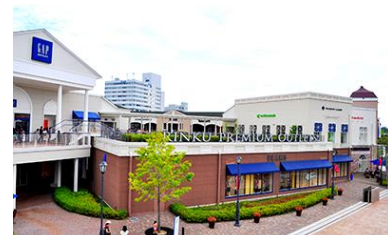
ให้มีลักษณะเหมือนกับเมือง

☐ ที่พัก: FP HOTELS GRAND SOUTH-NAMBA / Noku Osaka / ย่านคันไซ หรือระดับใกล้เคียงกัน กรณีพักโรงแรมFP Hotel สามารถเดินไปชินเซไก สปา เวิลด์และ ร้านดองกิโฮเต้ได้ (ชื่อโรงแรมที่ท่านพัก ทางบริษัทจะทำการแจ้งพร้อมใบัดหมายในวันก่อนวันเดินทาง)